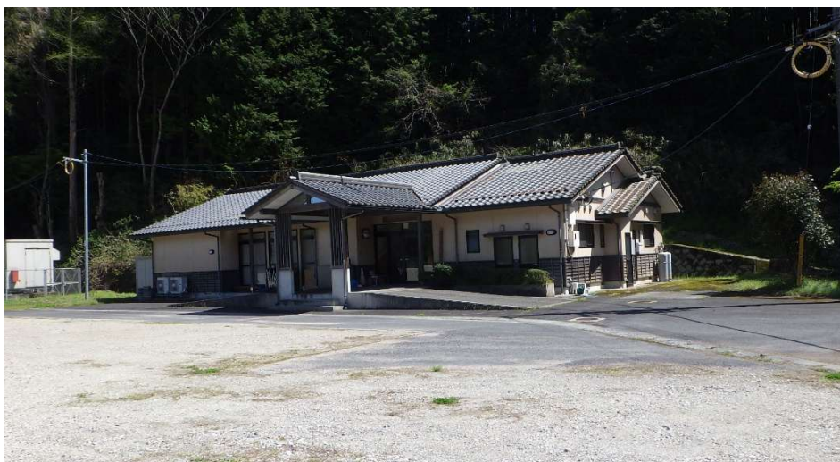
③大埴和ふれあいセンター