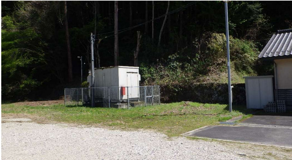
美咲ネットサブセンター