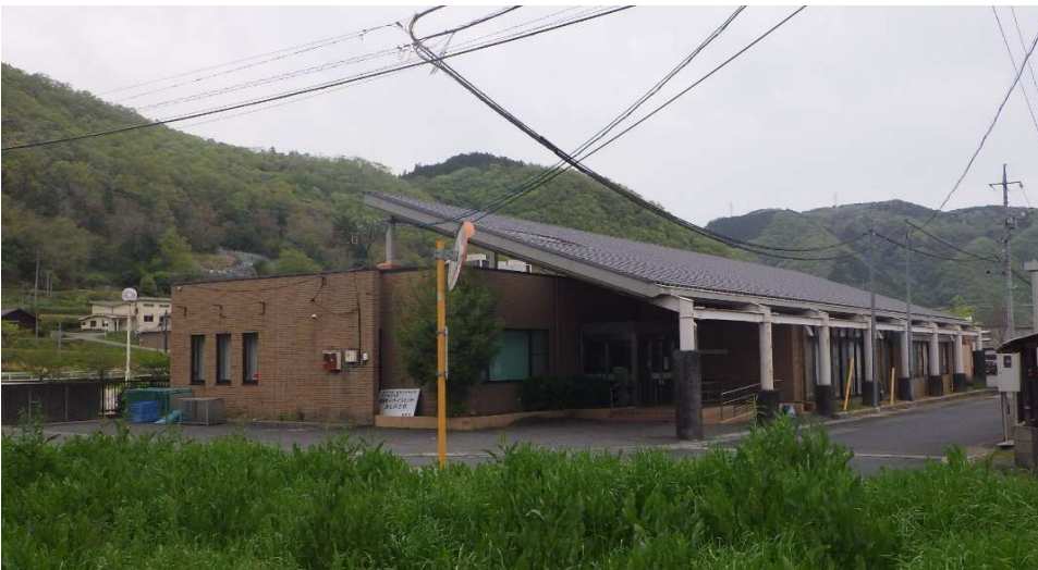
福祉センター南西面