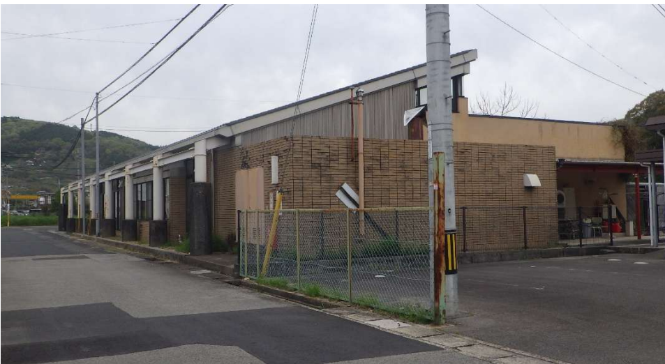
福祉センター南東面