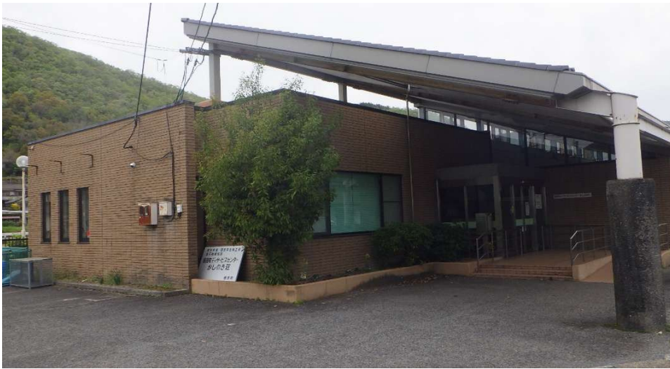
福祉センター玄関